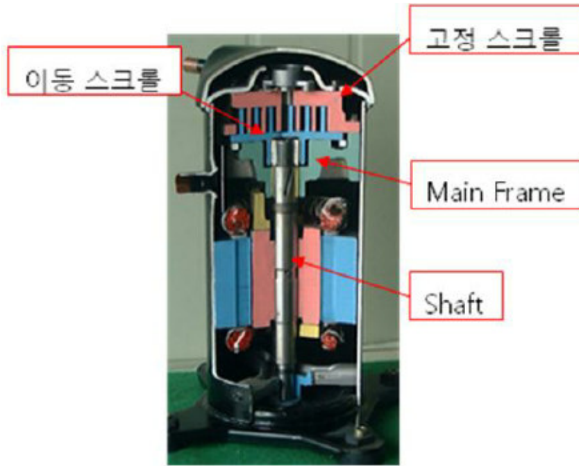
전자부품용 comp 부품