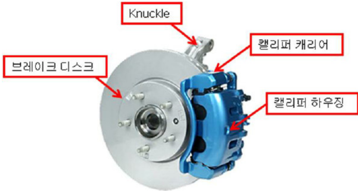
자동차 제동장치 부품